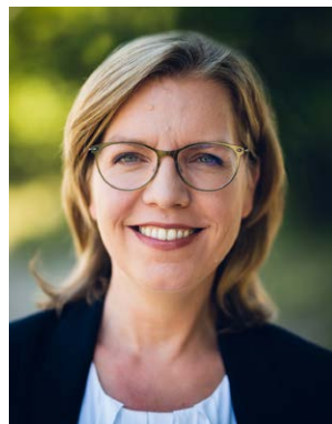
Bundesministerin Leonore Gewessler

Besonders erwähnenswert ist darüber hinaus, dass auch im Bereich der kooperativen Dienste über C-ITS-Technologie weitere österreichische Städte als Partnerinnen für die C-Roads-Plattform gewonnen werden konnten. Das Interesse der Städte zeigt, dass diese Technologie neben der raschen Umsetzung im Autobahn- und Schnellstraßennetz auch im urbanen Umfeld und vor allem auch im öffentlichen Verkehr nutzbringend eingesetzt werden kann. So sind z. B. in Wien bereits Straßenbahngarnituren mit C-ITS-Technologie ausgestattet und in den Städten Graz und Klagenfurt rollen die ersten ausgerüsteten Linienbusse im Verkehr.