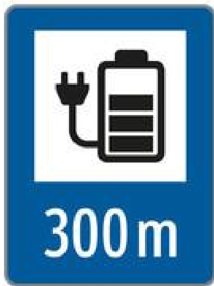
Abbildung 2 Hinweistafel für die Kennzeichnung einer E-Ladestelle, Bild: §53 Abs. 6b StVO

In der 33. StVO-Novelle aus 2022 (BGBl. I Nr. 122/2022, §53 Abs. 6b) wurde ein Hinweisschild (siehe Abbildung 2 Hinweistafel für die Kennzeichnung einer E-Ladestelle) für die Kennzeichnung einer E-Ladestelle eingeführt. Dieses Zeichen weist auf eine E-Ladestelle hin. Im blauen Rand kann die Entfernung bis zur E-Ladestelle angegeben werden.